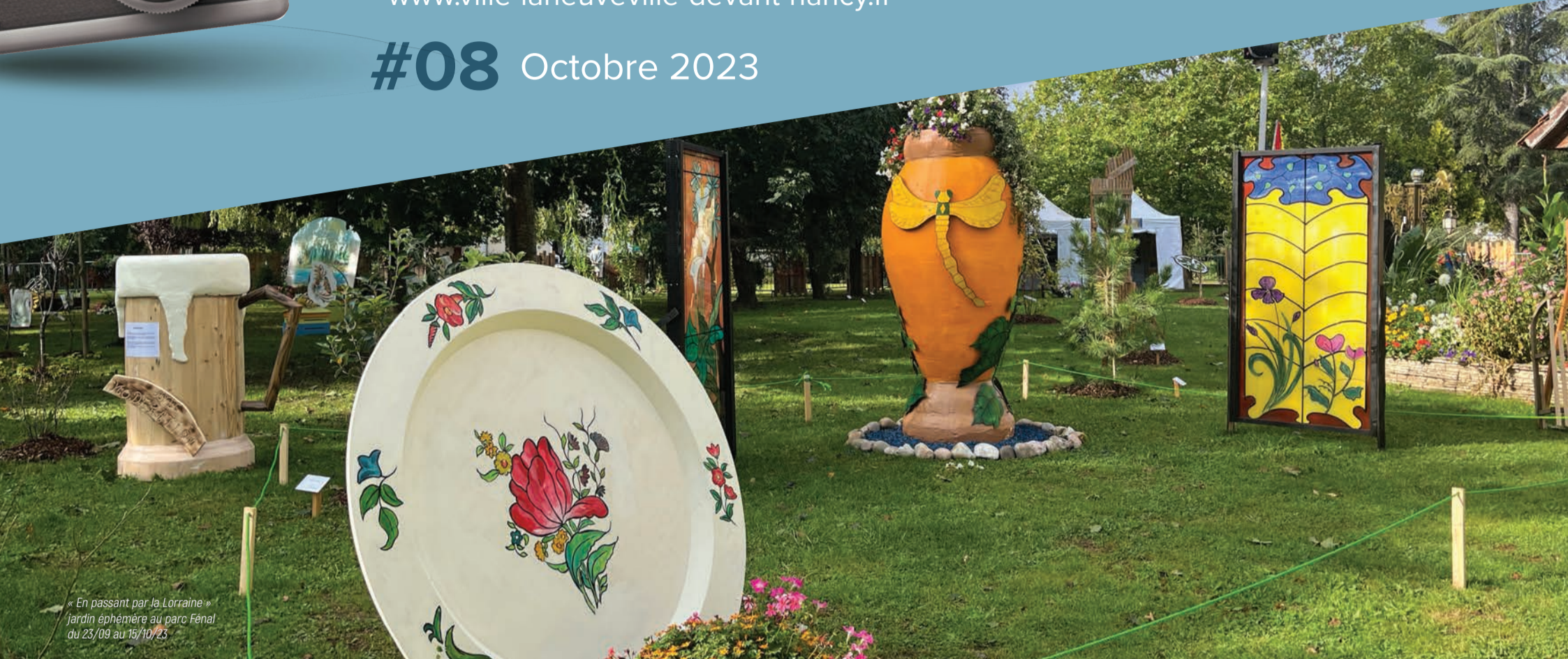
« En passant par la Lorraine » jardin éphémère au parc Fénal du 23/09 au 15/10/23