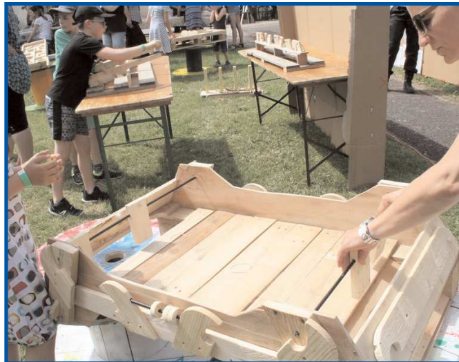
Jeux fabriqués par les ados.