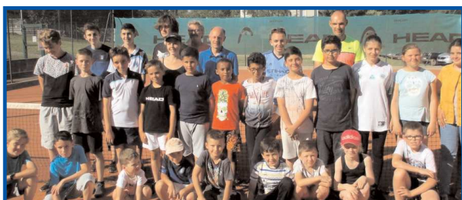
Remise des tests balles en juin 2018.