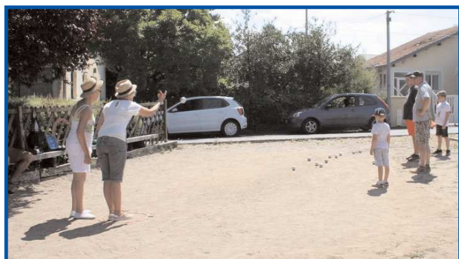
Tout le monde joue en famille.

Pour financer cette animation les jeunes s'étaient mobilisés pour des lavages des voitures et la livraison de petits déjeuners en mai 2018. Ils pensent déjà à l'édition de 2019 et ont organisé un concours de boules en famille, avec l'aide du Club de pétanque local, le 30 juin 2018 afin de commencer à provisionner leur budget.