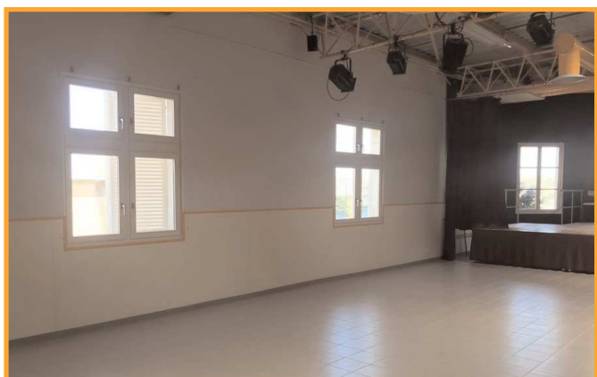
Réfection de la salle polyvalente par les services techniques et remplacement du parquet par un carrelage posé par un professionnel.