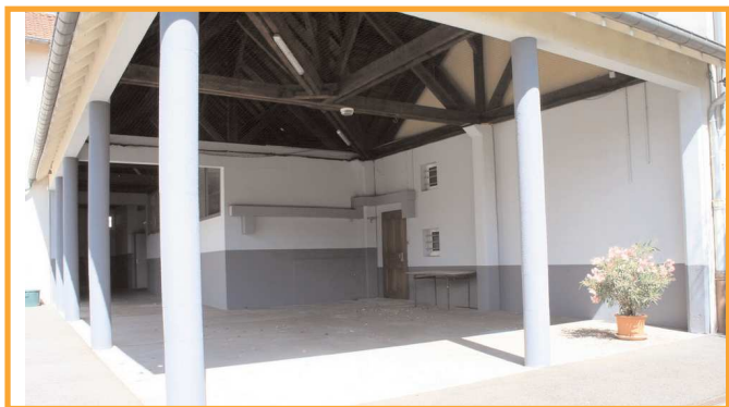
Le préau de la cour de l'école primaire de Montaigu a été repeint.