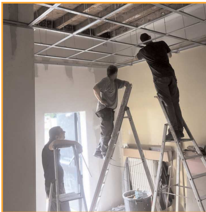
Le personnel à l'oeuvre pour la réhabilitation du local.

Suite à la vente des appartements de La Madeleine, il nous fallait une chaufferie individuelle pour les salles de l'ancien groupe scolaire.