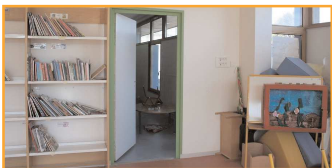
Création d'une issue de secours dans la salle BCD de la maternelle des 5 Fontaines.

Merci à notre équipe des services techniques pour la qualité de leur travail réalisé cette année sous la canicule !!!!