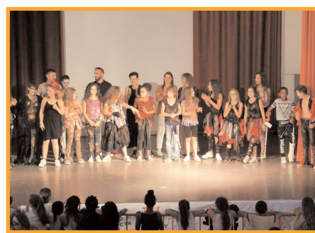
A l'école de Montaigu.

Après trois ans d'existence, les temps d'activités périscolaires se sont arrêtés en juin 2018. Les parents ont pu apprécier le travail de leurs enfants à travers les expositions des différentes réalisations manuelles et artistiques présentées dans les derniers jours de juin.