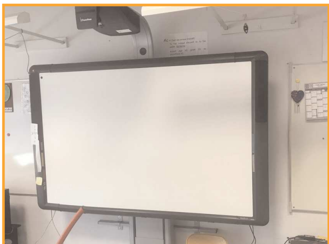
Installation d'un tableau blanc interactif (TBI) dans une classe de l'école primaire des 5 Fontaines.