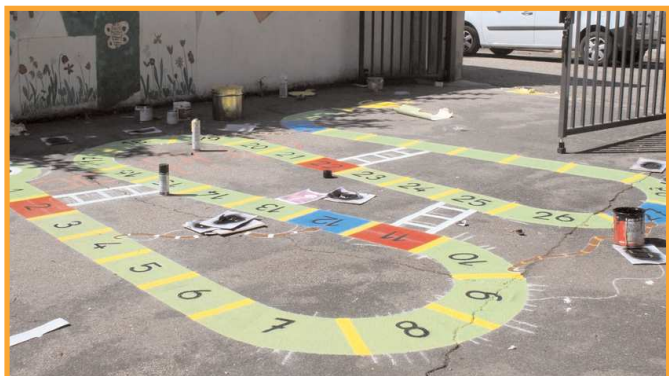
Peintures au sol de jeux éducatifs dans la cour des maternelles de l'école du Centre et des 5 Fontaines.