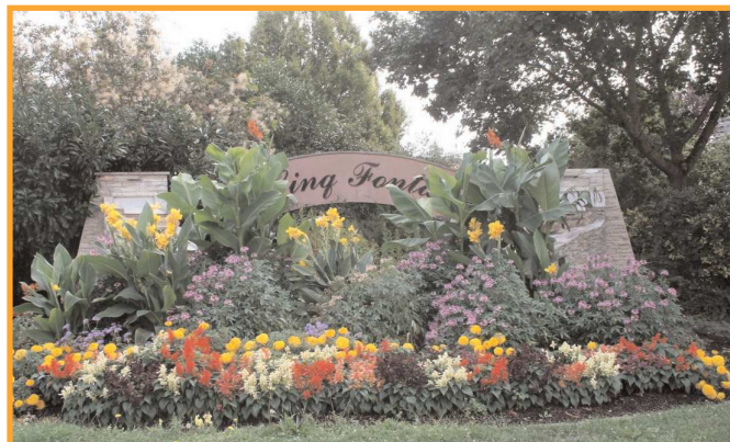
Très belle réalisation à l'entrée des 5 Fontaines.

De très belles réalisations florales implantées avec art sur la commune par le personnel du service des "espaces verts" pour le plaisir des yeux.