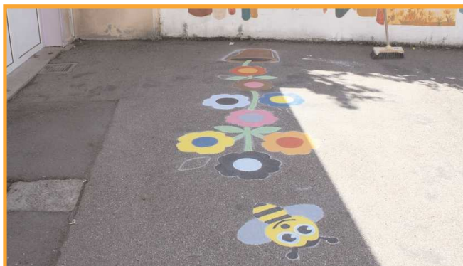
Beaucoup d'imagination puisque l'on peut découvrir une magnifique fleur et une abeille pour cette marelle.