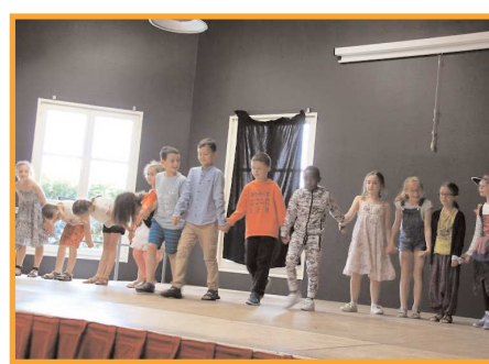
A l'école du Centre.