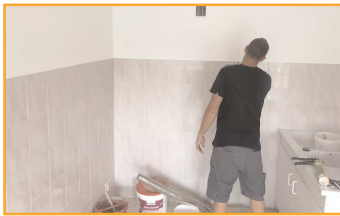
Rafraîchissement d'un appartement à la résidence La Mairaine par le personnel des services techniques.