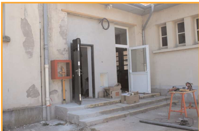
Création d'une porte coupe-feu extérieure aux normes.

La chaufferie a été mise en place par un professionnel qualifié en la matière.