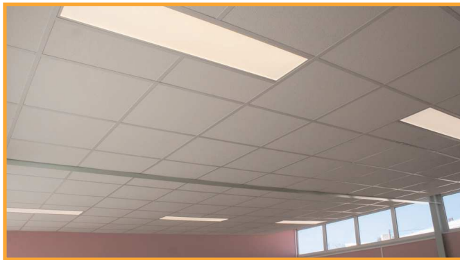
Toutes Les classes de la maternelle Montaigu ont été dotées de lampes leds dans le cadre des économies d'énergie.