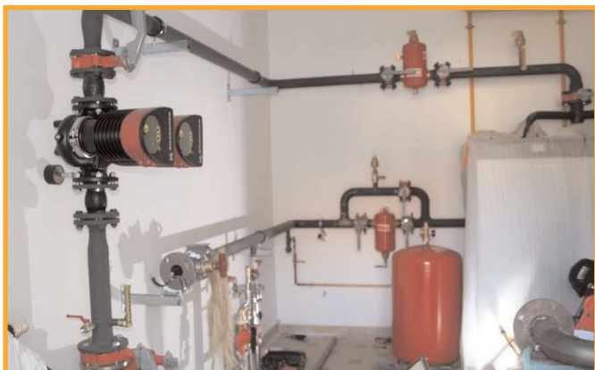
Mise en place de la chaufferie.