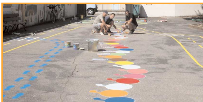
Peintures au sol de jeux éducatifs dans la cour des maternelles de l'école du Centre et des 5 Fontaines