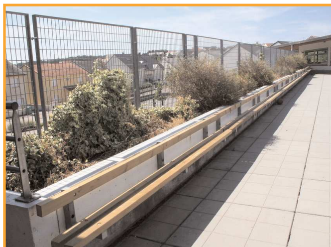
Réfection des bancs de la cour de l'école primaire des 5 Fontaines.