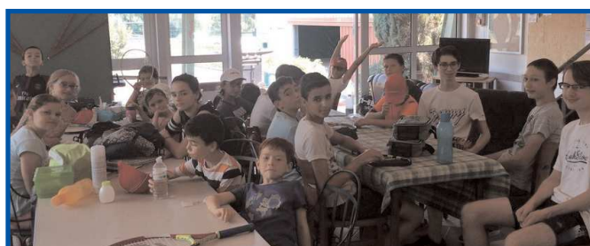
Stage du mois de juillet 2018.